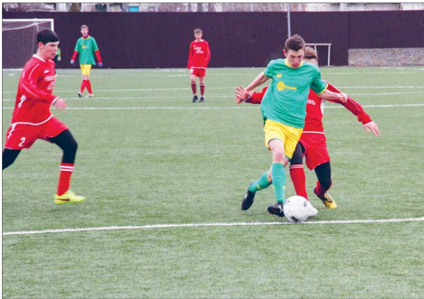
Богучарцы не проиграли ни одного матча

По итогам зонального тура команда «Темп-99» забила 33 гола и пропустила только один мяч