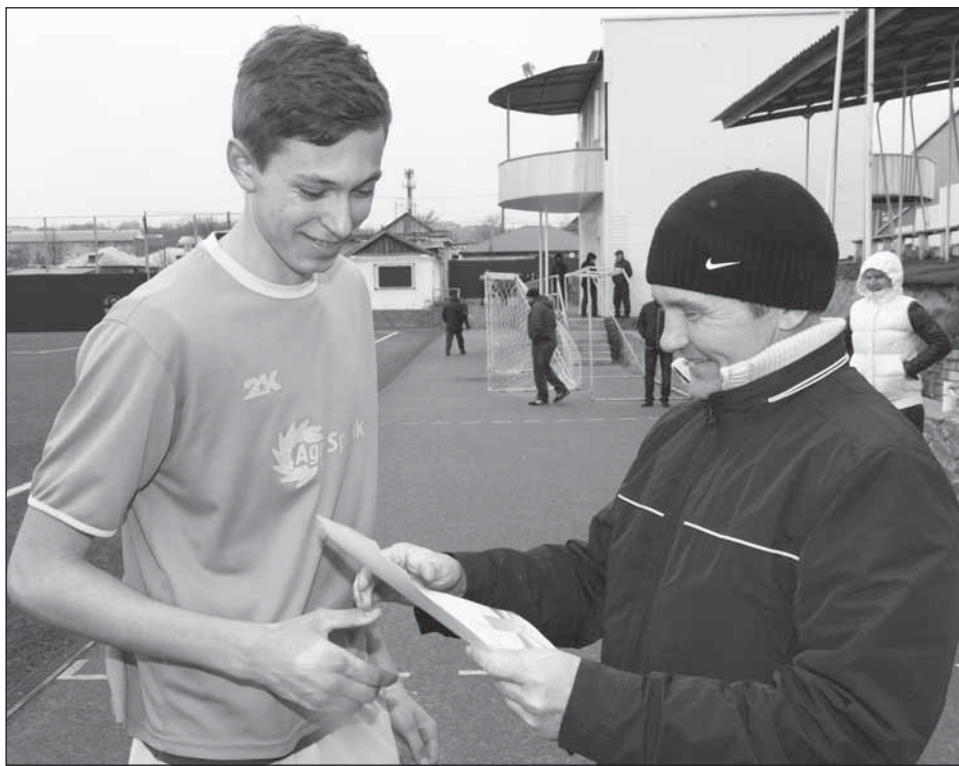
■ Приятный момент награждения

В прошлом году команда «Темп-99» стала чемпионом Воронежской области по футболу, призером ЦФО, а также заняла пятое место во всероссий-